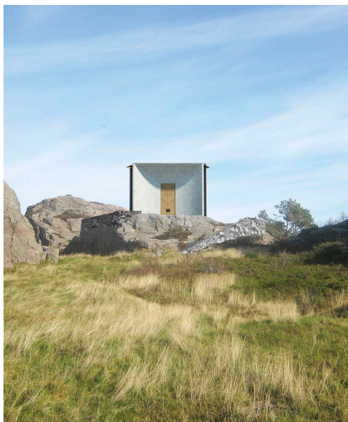
Kapellet i Ny Hellesund, Kima Arkitektur