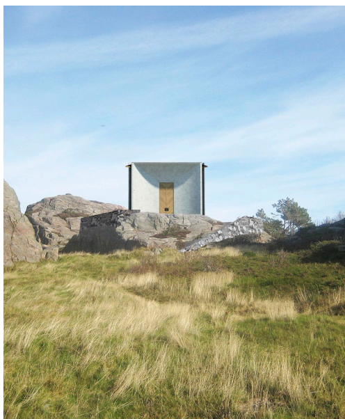
Kapellet i Ny Hellesund, Kima Arkitektur