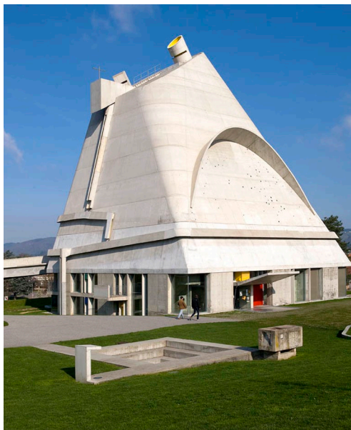
Saint-Pierre de Firminy Church, Frankrike